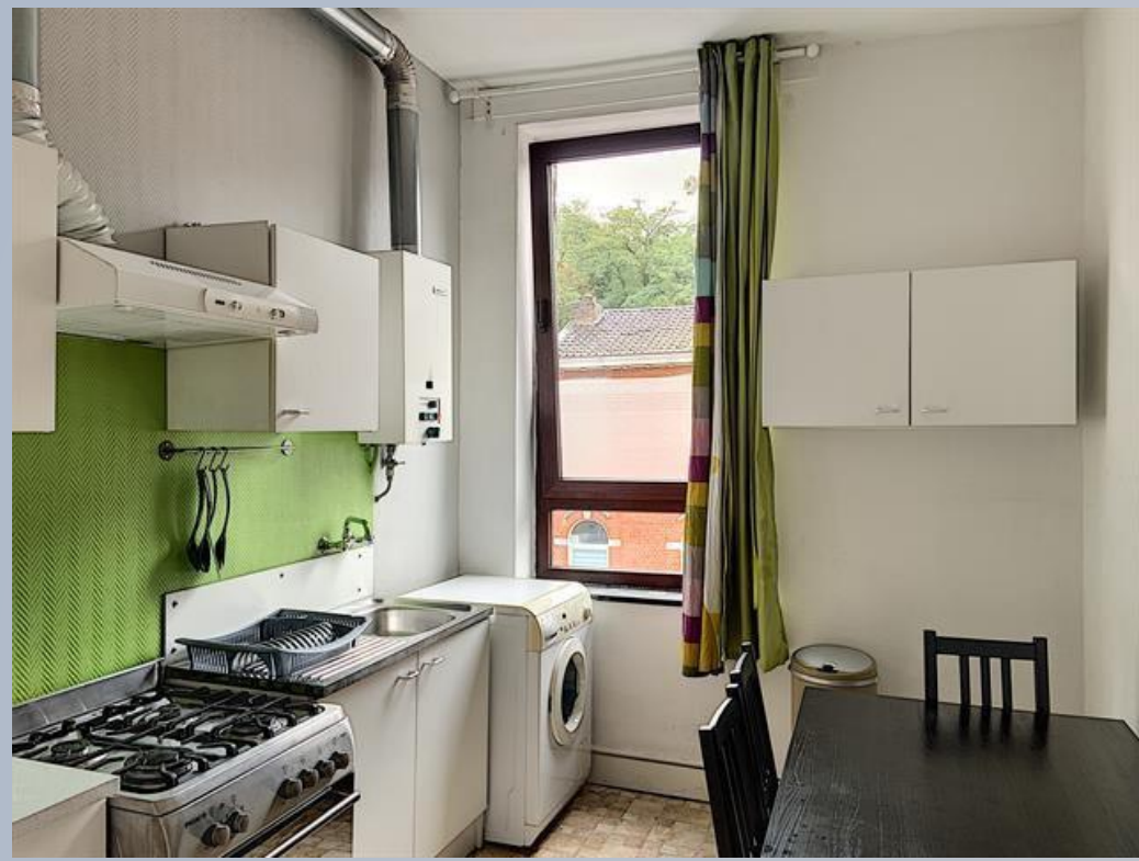
APARTAMENTO - € 550